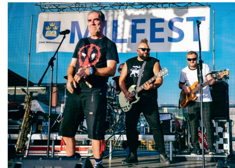
MILFEST 2023 - skupina Polemic