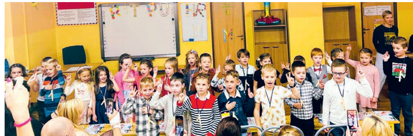
Imatrikulácia 1. A - sľub prvákov