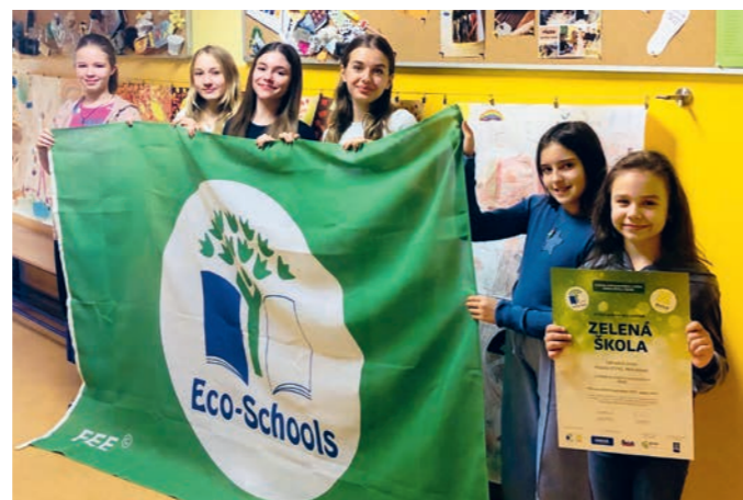
Vlajka Zelené školy