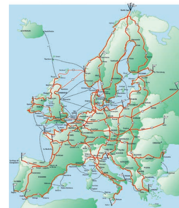
Sieť cyklotrás EUROVELO v Európe

kraje aj krajiny. Medzi nimi sa vynímajú medzinárodné cyklomagistrály EuroVelo , celkovo ich je v Európe navrhnutých 17 ks o celkovej dĺžke vyše 90 tis. km. Tri z nich prechádzajú cez územie Slovenska a dve sa vinú celkom neďaleko od našej obce.