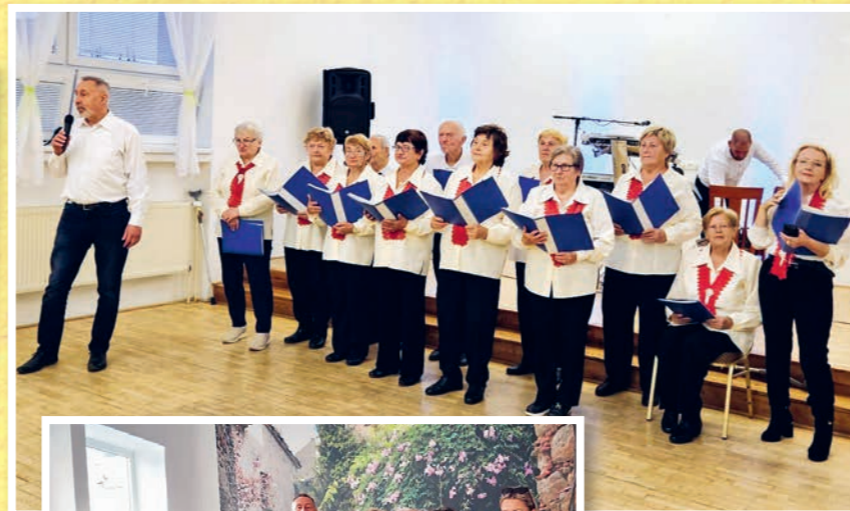
Spevokol Radosť na cestách (21. 10. 2023)