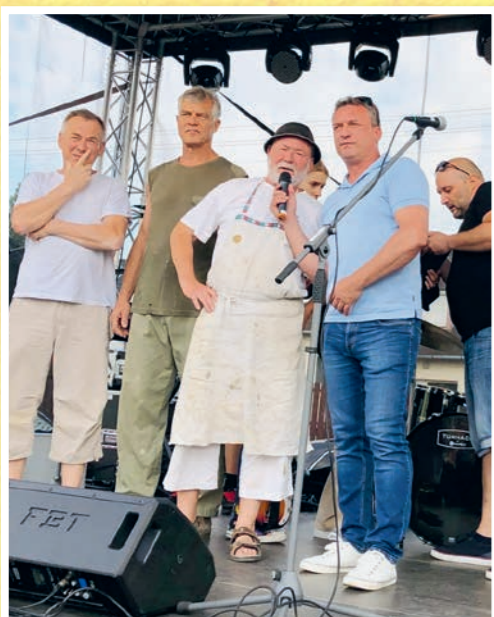
Deň obce (24. 6. 2023)