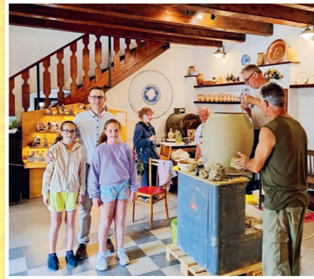
Slovenský rekord v točení najvyššej hlinenej nádoby (24. 6. 2023)