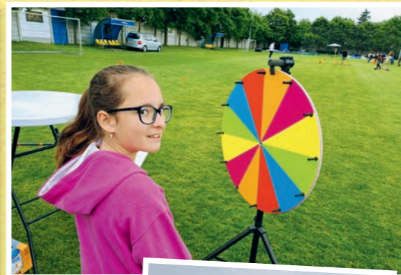
Deň detí (4. 6. 2023)