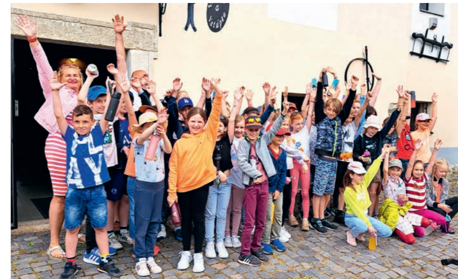
Deti našej školy pri otváracom koncerte k výstave hudobných nástrojov dňa 17. mája 2023

V spolupráci so žitnoostrovským múzeom v Dunajskej Strede pripravujeme významné rozšírenie stálych expozícií