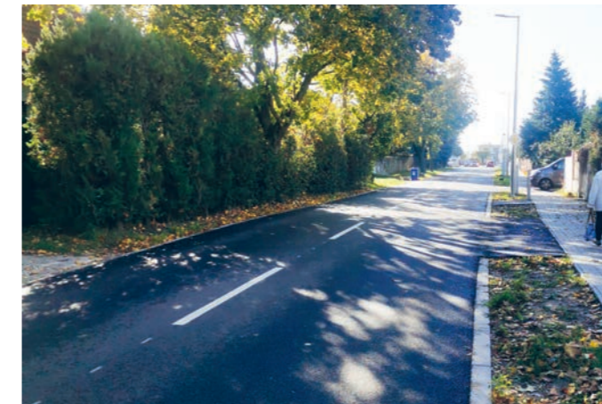
Lesná, smer Nová ul. po rekonštrukcii