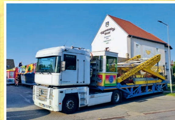
Kolotoče na sviatok sv. Bartolomeja – „hody“ (24. 8. 2023)