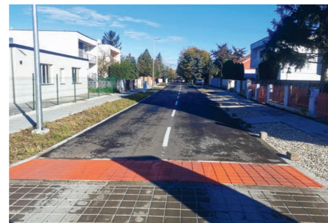
Lesná ul. pri OcÚ po rekonštrukcii