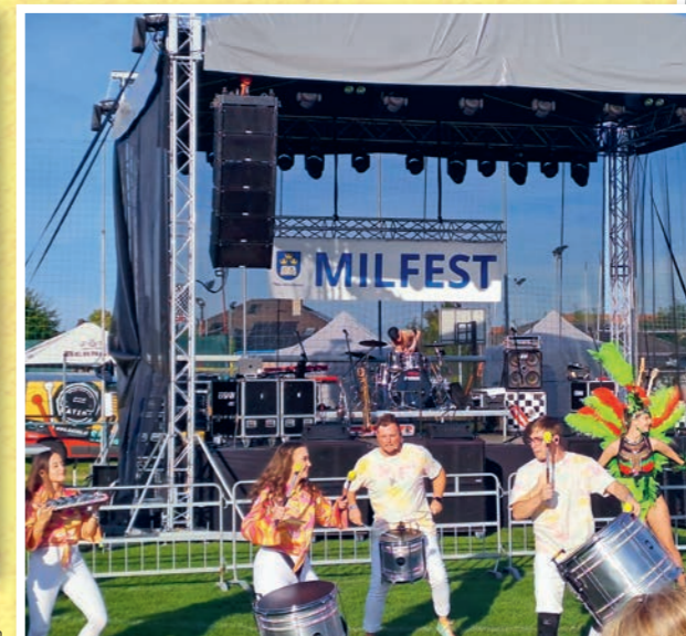
MILFEST (9. 9. 2023)