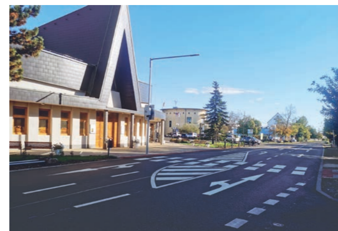
Križovatka ulíc Hlavná a Lesná po rekonštrukcii

Ukončené projekčné práce, ktorých výstupom bola kompletná projektová