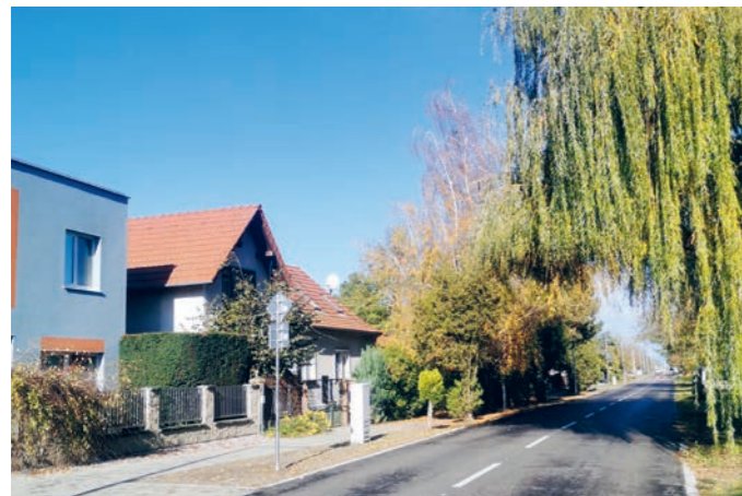
Križovatka ulíc Kysucká – Lesná – Kvetná po rekonštrukcii