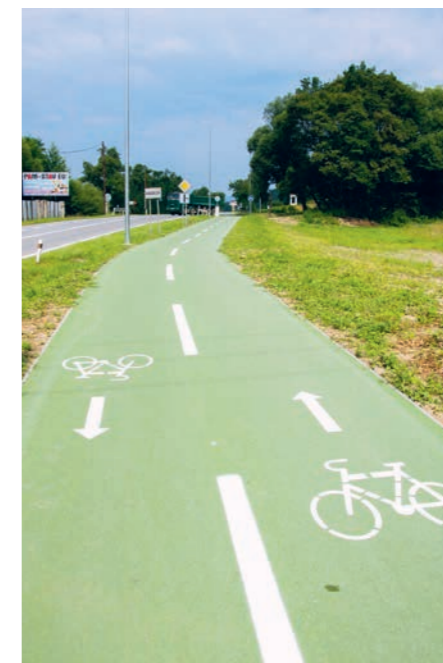
Medzinárodná cyklotrasa AQUAVELO

Červenou farbou sú označované diaľkové trasy, ktoré prepájajú okresy,