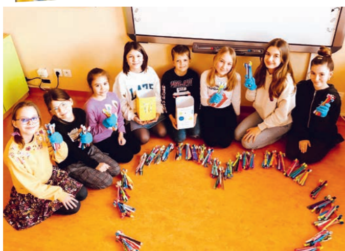
Zbierka zubných kefiek