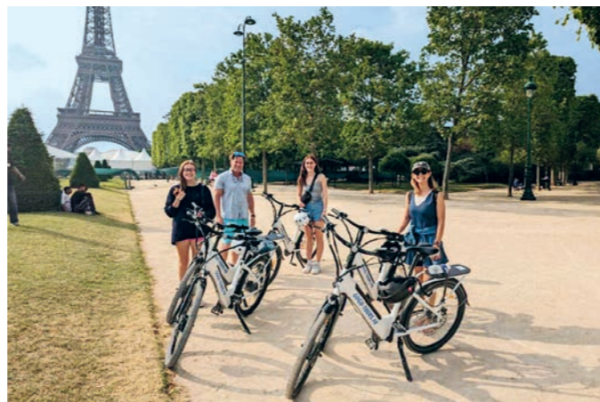
Cykloturisti v Paríži