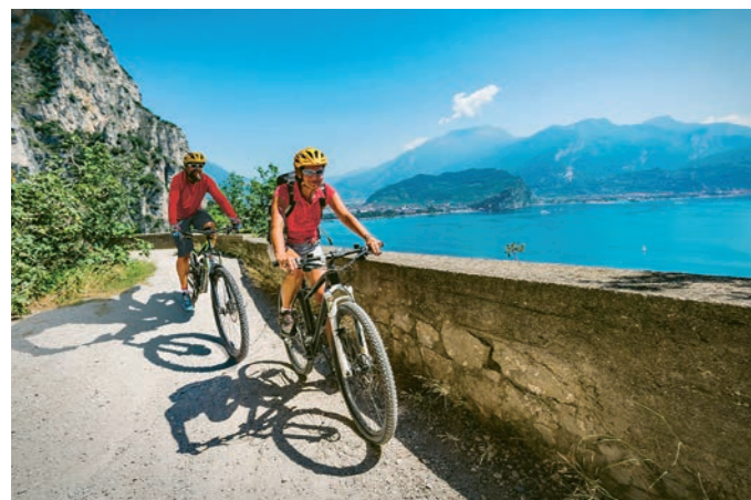
Jazero Lago di Garda - Taliansko

Približne do roku 2000 obec neevodovala potrebu vytvárať samostatné